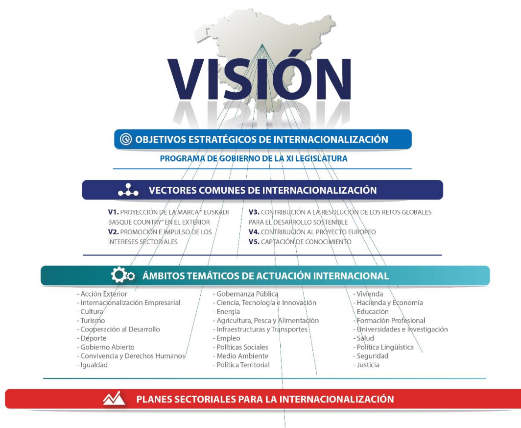
Ilustración 1: Actualización del esquema de la EBC 2020